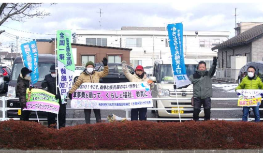
岩瀬・須賀川地方労連のみなさん