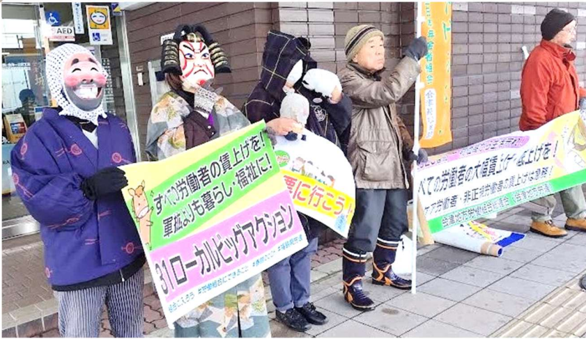
【講評】「お面がよい」「なぜこの格好？というのがありますが、仮装してくれたのでよかったです」他