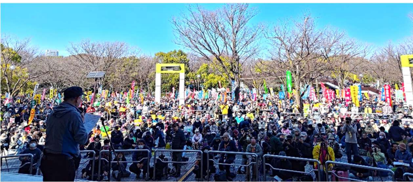
3月7日、東京・代々木公園で「とめよう原発！3・7全国集会」が開かれ、全国から8500人、ふくしま復興共同センターから40人が参加。集会後にパレードも行い、「原発事故は終わっていない」「原発ゼロ」「再エネ推進」を訴えました。