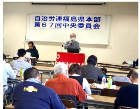
自治労連福島県本部は、2月21日、郡山市で「第67回中央委員会」を開催。組織拡大を中心に議論し、今年の拡大目標などを意思統一しました。