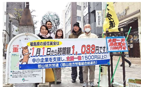
郡山地方労連のみなさん