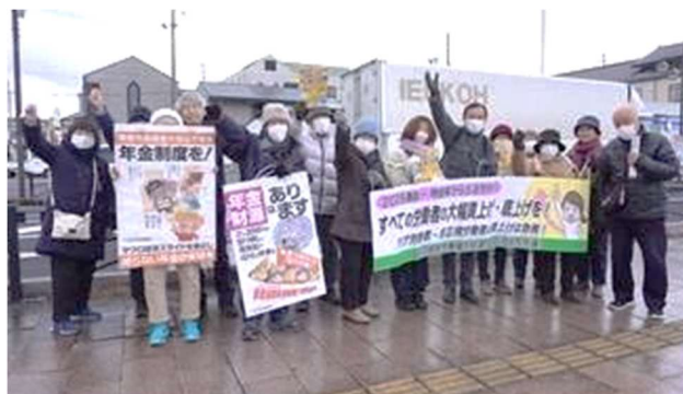
【講評】 「雨の中の奮闘にエール」「元気にアピールしている様子が伝わる」他

日に開かれた「福島県労連第8回幹事会」で厳正なる審査を行った結果、このような結果となりました！ ご参加くださったみなさん、ありがとうございました。入賞されたみなさん、おめでとうございます！