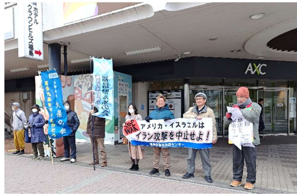
福島県憲法共同センターによる「イラン攻撃中止」を 求める宣伝行動(3月9日、福島市)

2月28日に開始された、アメリカとイスラエルによるイラン攻撃は、国連憲章と国際法に違反する乱暴な先制攻撃です。「イランへの軍事攻撃はただちに中止せよ」「国際法にもとづく外交で解決を」の声を上げましょう。