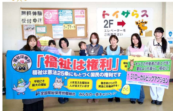
【講評】 「大きな横幕を用いてわかりやすい」「子どもも参加」「職場単位で参加してくれたので」他