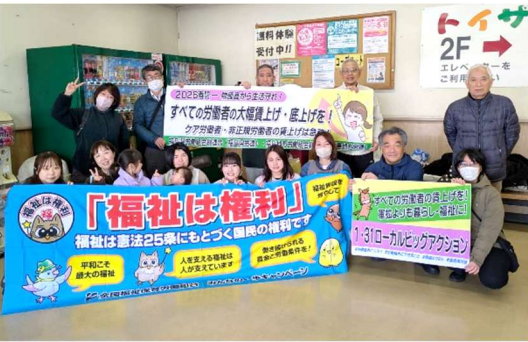
福島地方労連のみなさん